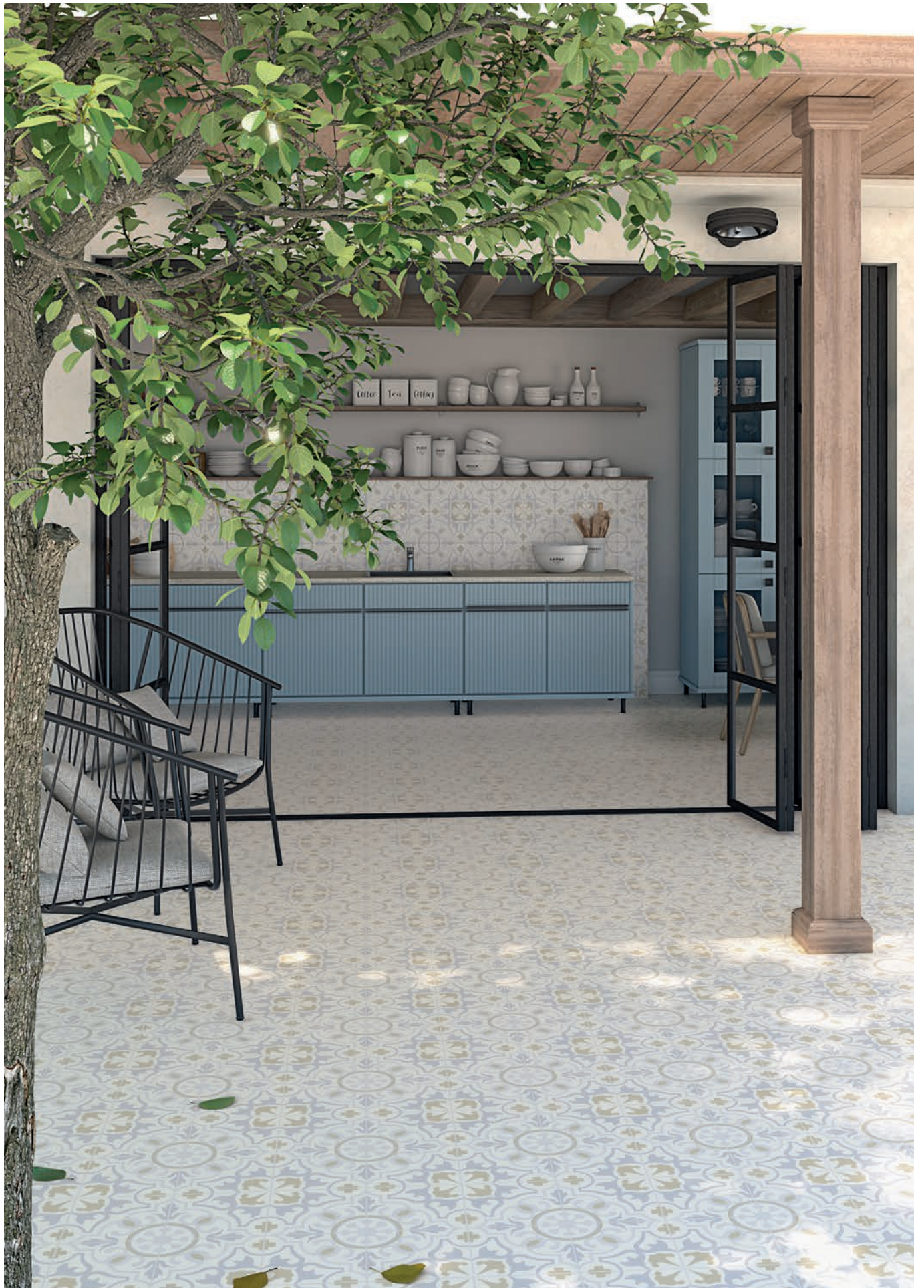
Jolejon - 20x20 cm.