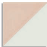
Tre Rosa G.156