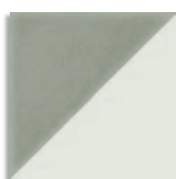
Tre Jade G.156