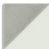
Tre Humo G.156