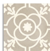
Blomknopp Siena G.156