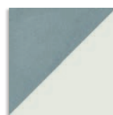
Tre Nube G.156