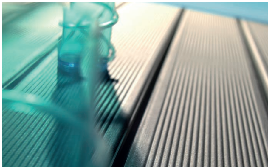
Moorea-R Blanco · 14,3x119,3 cm.